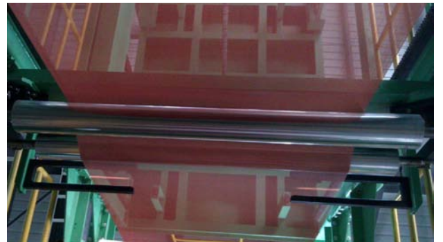
Fotoelektrik Orta Sensörler DCP-450 bir Son Pivot Guide ile kullanılmaktadır.